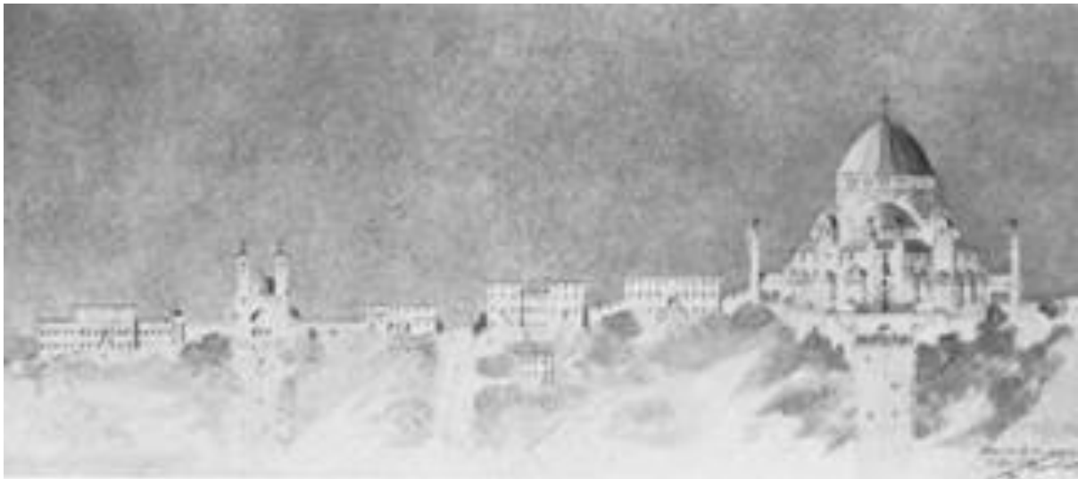
Schetsplan van de te bouwen kerken op de Heilig-Land-Stichting. Links de Cenakelkerk op de Uselenberg rechts de geplande H. Hart-basiliek op de Bakkersberg.