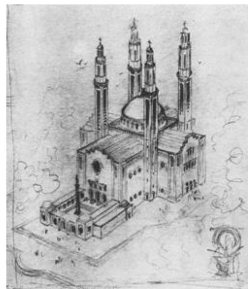
H. Hartbasiliek - 2 e ontwerp fase 2 Vogelvluchtschets van J. Stuyt