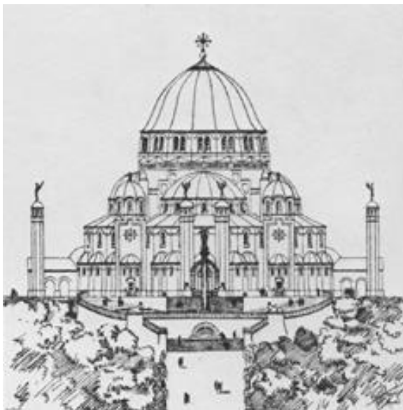
H. Hartbasiliek - propaganda-ansicht Eerste ontwerp van J. Stuyt